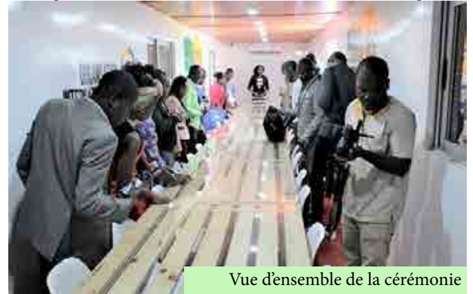
Vue d'ensemble de la cérémonie de remise d'attestation

Pour rappel, l'initiative «Libres Ensemble» a été lancée le 10 mars 2016 par les jeunes francophones et la Secrétaire générale de la Francophonie en réaction au phénomène croissant de radicalisation violente (politique, idéologique, sociale et religieuse) des jeunes et à la multiplication d'actes terroristes survenus dans l'espace francophone. Cette initiative appelle les jeunes à se mobiliser, s'exprimer, participer et s'engager par des actions concrètes au service de la diversité, de la paix, de la liberté, du «Vivre ensemble», afin de prévenir le risque de radicalisation politique, idéologique, sociale et religieuse menant à la violence.