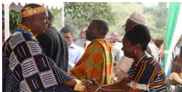
Le Ministre de la Culture et de la Francophonie saluant Mme la Secrétaire Générale Adjointe de la CNF