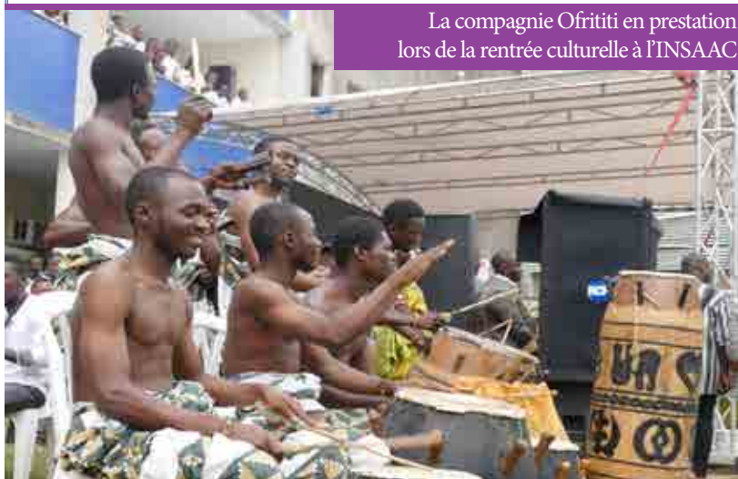
La compagnie Ofrititi en prestation lors de la rentrée culturelle à l'INSAAC