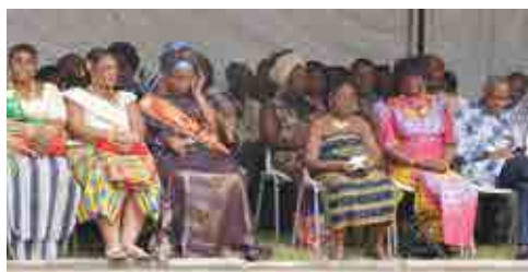
De gauche à droite , les Awoulaba 2017 et l'artiste chanteuse Allah Thérèse