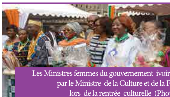
Les Ministres femmes du gouvernement ivoirien honorées par le Ministre de la Culture et de la Francophonie lors de la rentrée culturelle (Photo de famille)